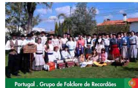
Portugal . Grupo de Folclore de Recardães