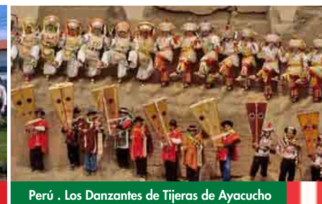
Perú . Los Danzantes de Tijeras de Ayacucho