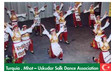
Turquia . Mhot – Uskudar Salk Dance Association