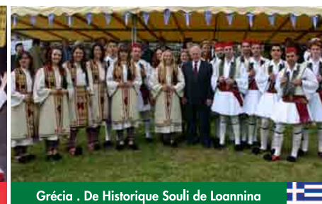
Grécia . De Historique Souli de Ioannina