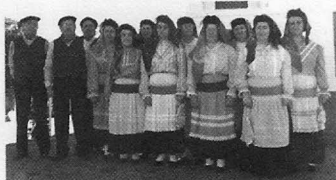
Grupo de Cantares Tradicionais da Forcada

Fundada a 08/12/1989 Constituída a 06/04/1990, por escritura pública